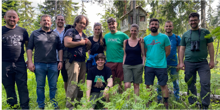
Фотографии од Партнерскиот состанок на БЛРП во јуни 2023 г