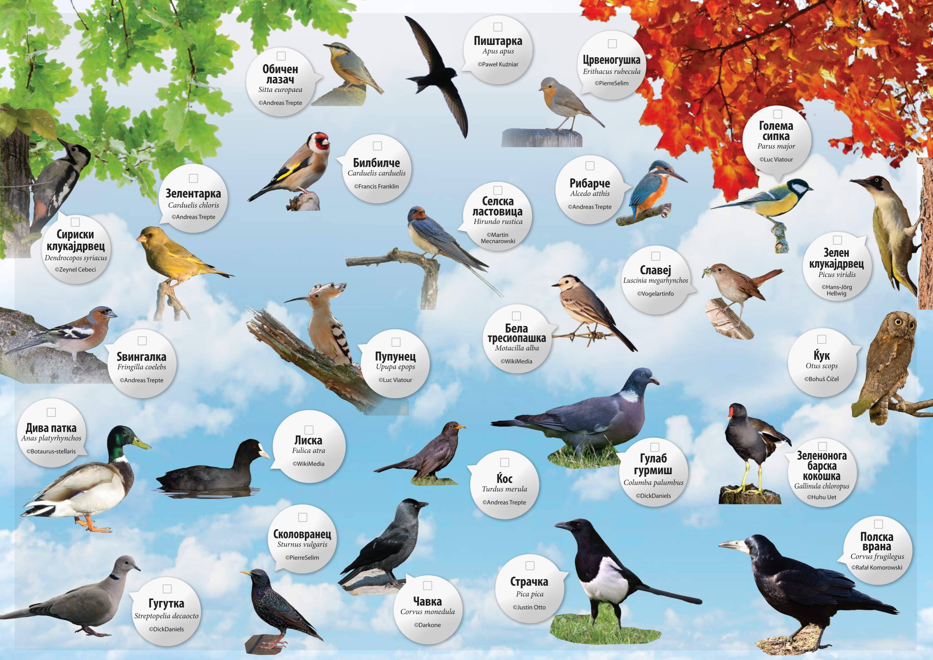
Обичен лазач Sitta europaea