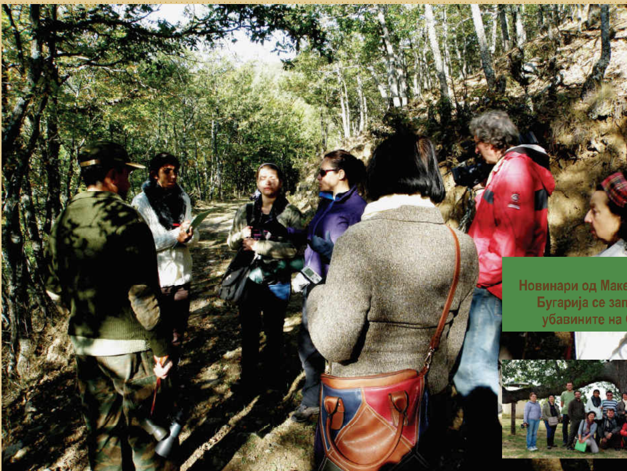
Новинари од Македонија и Бугарија се запознаа со убавините на Осогово!