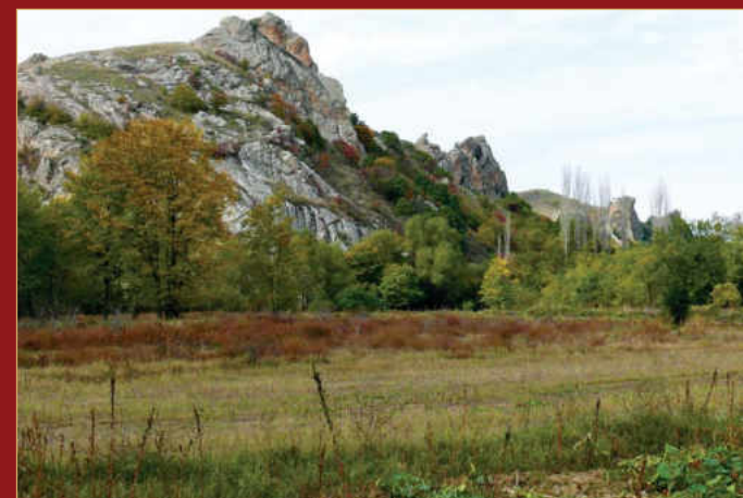
Црниот штрк ( Ciconia nigra ), египетскиот мршојадец ( Neophron percnopterus ) и лисестиот глувчар ( Buteo rufinus ) гнездат во ЗПП Крива Река - Пчиња - Петрошница.

Balkans ). Проектот започна со реализација во пет држави на Балканот од март 2010 година и ќе трае до јануари 2012 година. Активностите предвидени за остварување на главната цел на проектот опфаќаат: