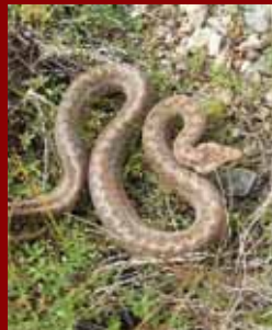
Медена змија ( Coronella austriaca )

рија е регистрирана во неколку наврати. На Осогово се среќаваат некои ендемични видови т.е. видови кои се распространети на мал географски простор. Некои од нив живеат единствено на Осоговските Планини. Такво е растението Genista fukare-