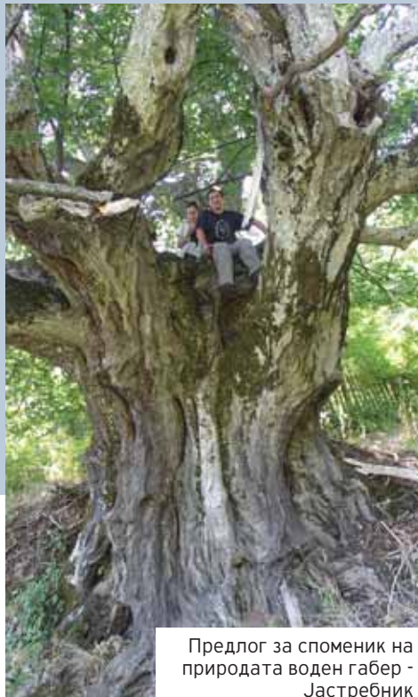
Предлог за споменик на природата воден габер - Јастребник

Вклучувањето на локалните заедници во процесот на заштита на животната средина е еден од главните елементи за одржлив развој на Осоговскиот регион и оттаму проектот се насочува кон градење на локалните капацитети со цел правилно искористување на потенцијалите.