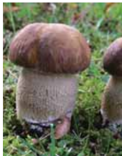
Летен врѓањ (Boletus edulis)

Овие планини се одликуваат по пространите букови шуми во високиот дел и претставителни горунови шуми во понискиот дел од планината. Високопланинскиот појас изобилува со пасишта, врштини и тресетишта. Тресетиштата се живеалишта