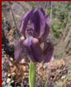
Перуника ( Iris germanica )