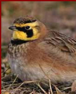
Ушеста чучулига ( Eremophila alpestris )