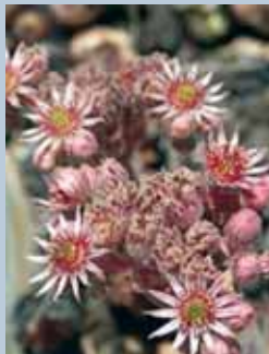
Чувар кукѝа ( Sempervivum roseum )

кои се особено ретки во Македонија, а најдобро се развиени и сочувани на Осогово. И покрај изразената деградација, особено во понискиот дел од Осогово, сепак планината претставува важен коридор за крупните сверови. Поврзувањето на се-